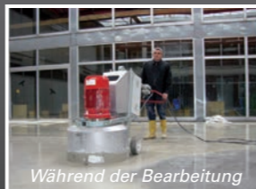
Während der Bearbeitung