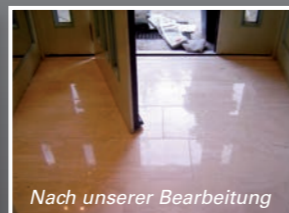
Nach unserer Bearbeitung