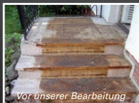
Vor unserer Bearbeitung