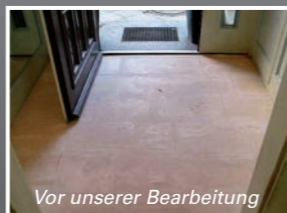
Vor unserer Bearbeitung

Ob Sie einen neuen Betonboden zu einem hochwertigen und repräsentativen Boden umgestalten oder ob sie einen bereits verschlissenen, verfärbten, verkratzen oder fleckigen Steinboden wieder zu einem neuen hochglänzenden Erscheinungsbild gestalten möchten - mit dem Schleifen des Bodens sind Sie auf der wirtschaftlich günstigsten und optisch -wie technisch- hochwertigsten Seite.