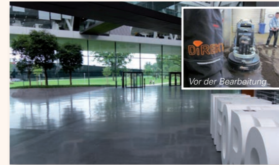
Vor der Bearbeitung