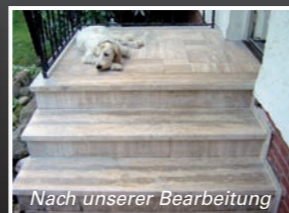
Nach unserer Bearbeitung

Damit Ihnen keine Einschränkung der Arbeits-, Produktions- oder Öffnungszeiten und somit keine zusätzlichen Kosten oder Ausfälle entstehen, verarbeiten wir Ihre Bodenbeläge selbstverständlich auch nachts oder am Wochenende.