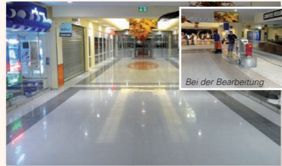
Bei der Bearbeitung