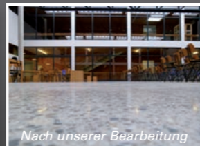
Nach unserer Bearbeitung