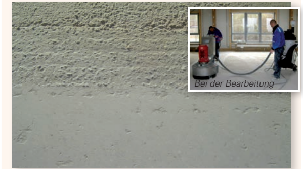
Bei der Bearbeitung