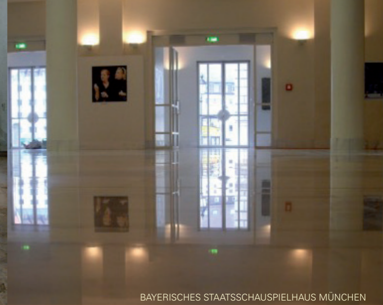
BAYERISCHES STAATSSCHAUSPIELHAUS MÜNCHEN