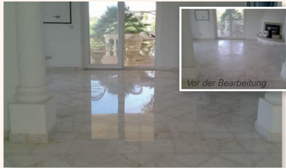
Vor der Bearbeitung